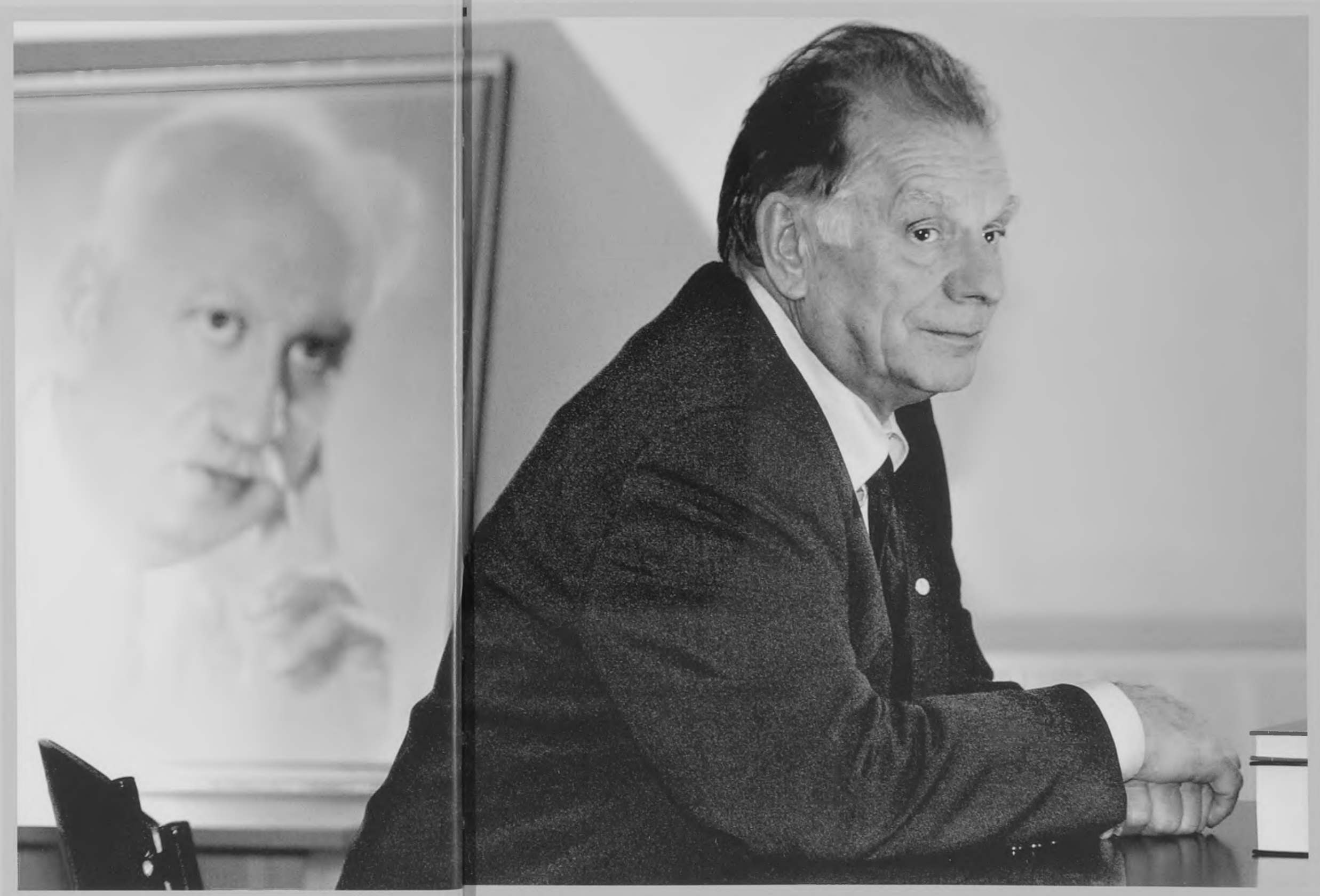
Жорес Иванович Алфёров.