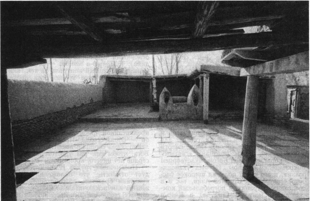
Бухара. Шиитская хазира Хусайн-хана. Снимок 80-х годов XX в. Ныне перестроена