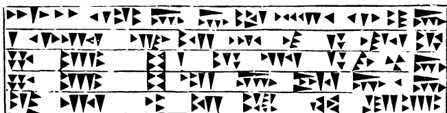
Inscription cunéiforme de Kalincha.

Postscriptum. On nous apprend durant l'impression, que M. Rawlinson a eu connaissance des inscriptions cunéiformes de l'Arménie russe, et qu'il en possède des copies. Autant que nous le sachions, le savant Anglais n'a encore rien publié sur ce sujet.