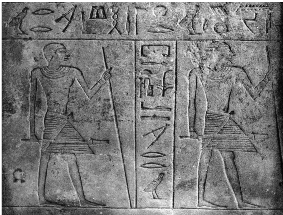
Ил. 1. Фрагмент архитрава из каталога Яманака

На архитраве сохранилось два текста: левая часть длинной горизонтальной надписи и вертикальная надпись с титулом и именем владельца, помещенная между двух идущих фигур сановника.