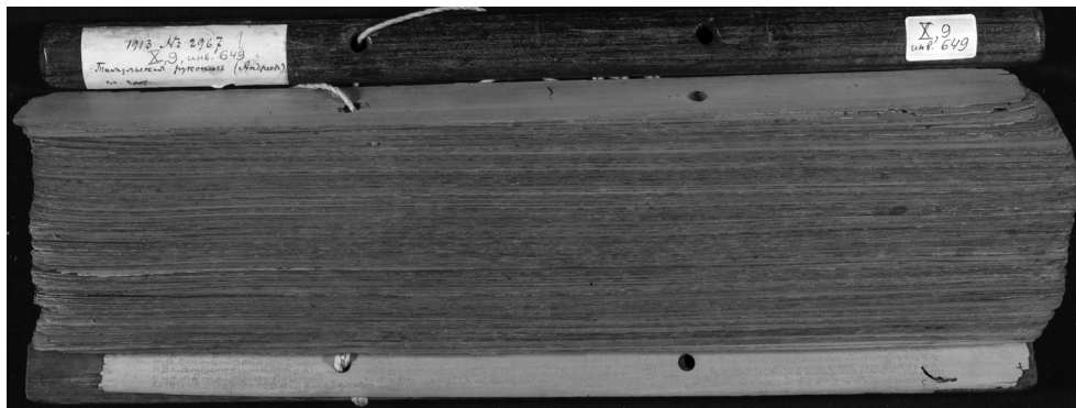
Ил. 3. Общий вид рукописи Ms. Ind. X, 9