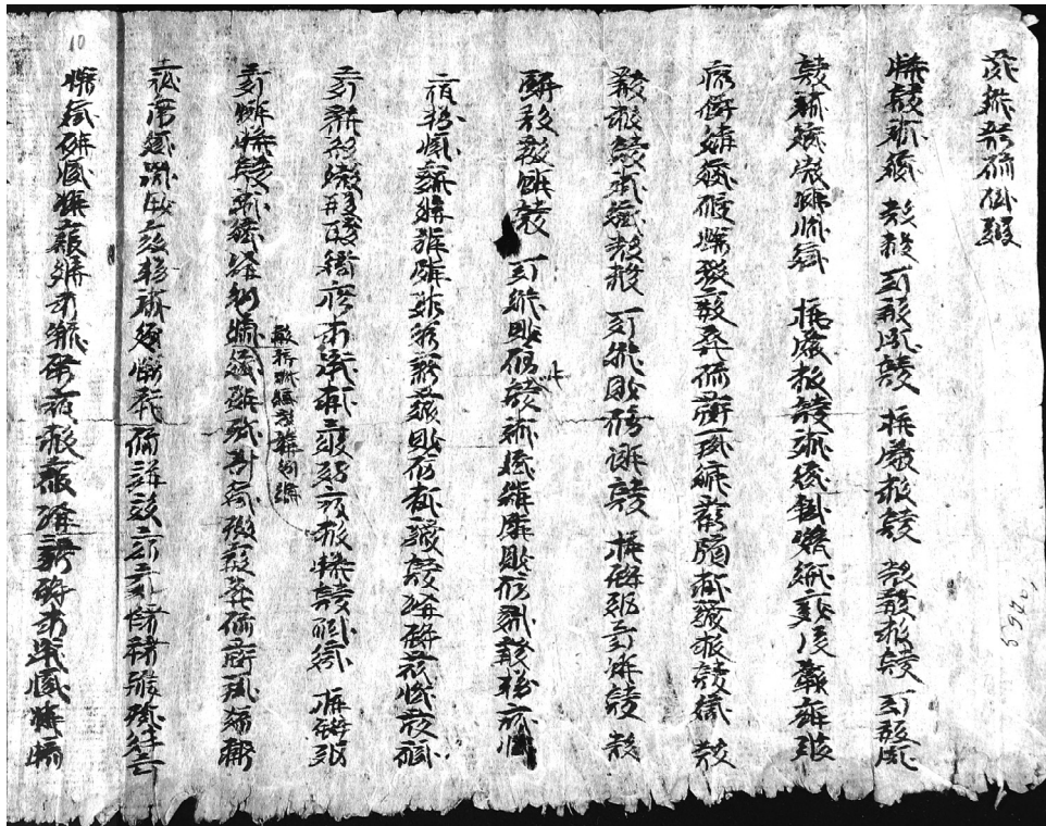
Текст «Шести учений». Тангутский фонд ИВР РАН. Шифр Танг 1872

первый, наивысший — перенос в Ясный свет, второй, промежуточный — перенос в другое тело 9 ,