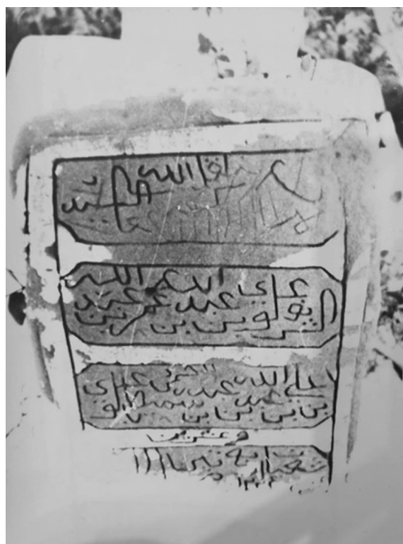
Ил. 7.1. Краткая эпитафия надгробия. Фото, сделанное П.А. Грязневичем в 1988 г. Поселение Қāрат ас-Санāхиджа

Интересным явлением следует признать наличие на могилах двух надгробий одного лица. Вероятнее всего, по инициативе родных некоторых погребенных надгробия с повреждениями либо краткими эпитафиями заменялись на другие, иногда с более пространными текстами, которые ставились рядом со старыми стелами. Всего таких парных надгробных надписей было обнаружено пять, однако в данной статье мы продемонстрируем для примера только две их пары: