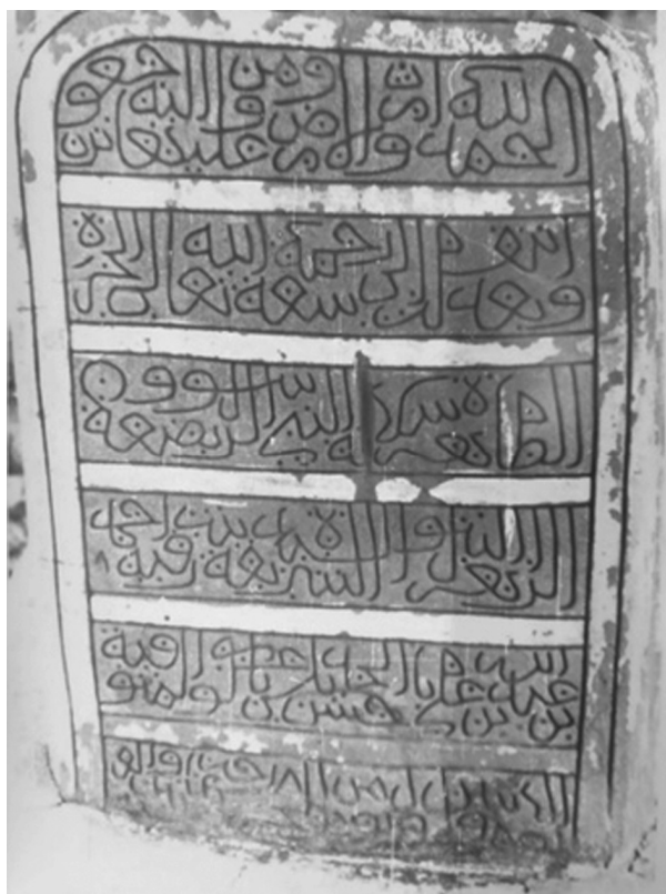
Ил. 3. Фото надгробия, сделанное П.А. Грязневичем в 1988 г. Поселение Қарат ас-Санāхиджа