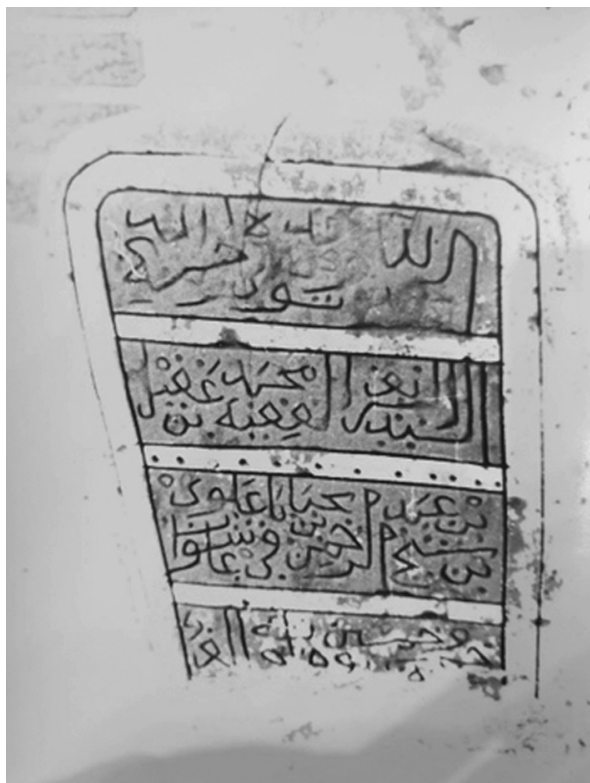
Ил. 8.1. Краткая эпитафия надгробия. Фото, сделанное П.А. Грязневичем в 1988 г. Поселение Қарат ас-Санāхиджа