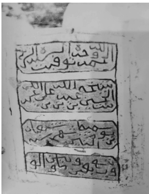
Ил. 6. Фото надгробия, сделанное П.А. Грязневичем в 1988 г. Поселение Қарат ас-Санәхиджа