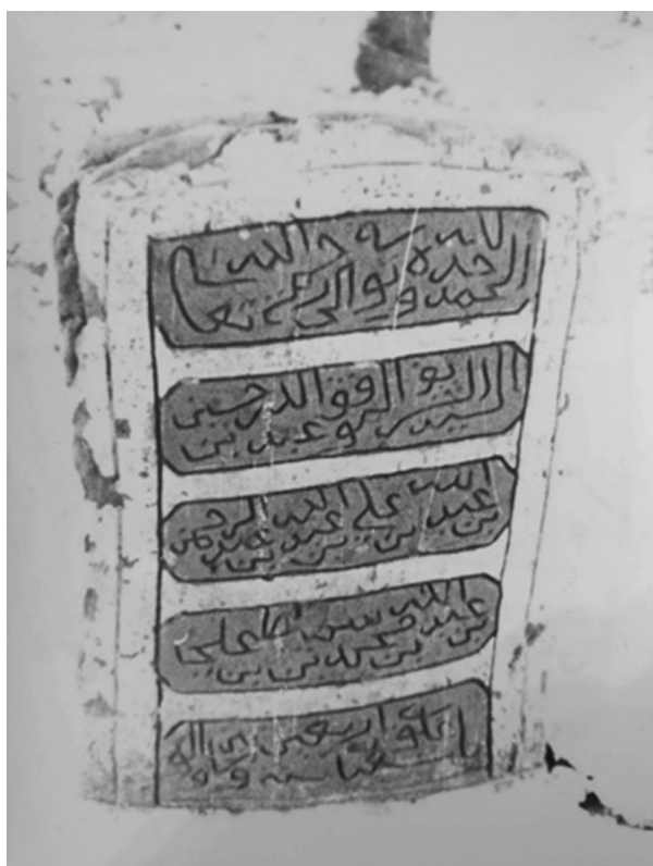
Ил. 5. Фото надгробия, сделанное П.А. Грязневичем в 1988 г. Поселение Қāрат ас-Санāхиджа