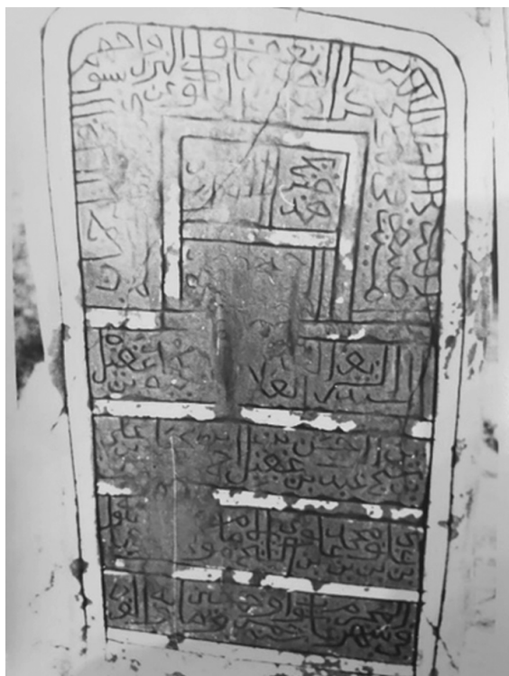
Ил. 8.2. Полная эпитафия надгробия. Поселение Қарат ас-Санāхиджа