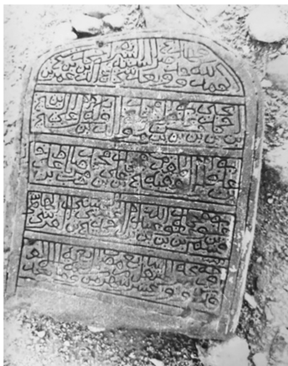
Ил. 1. Фото надгробия, сделанное П.А. Грязневичем в 1988 г. Поселение Қарат ас-Санāхиджа

Представим несколько примеров надгробных надписей, а к первому надгробию приведем генеалогию.