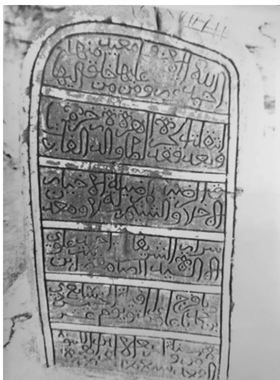
Ил. 2. Фото надгробия, сделанное П.А. Грязневичем в 1988 г. Поселение Қарат ас-Санāхиджа