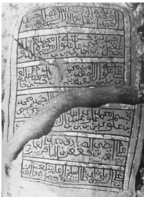
Ил. 4. Фото надгробия, сделанное П.А. Грязневичем в 1988 г. Поселение Қāрат ас-Санāхиджа