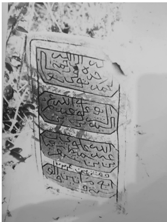
Ил. 7.2. Полная эпитафия надгробия. Фото, сделанное П.А. Грязневичем в 1988 г. Поселение Қарат ас-Санāхиджа