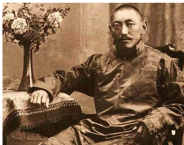
Далай-лама XIII (1876–1933). 1910 г.