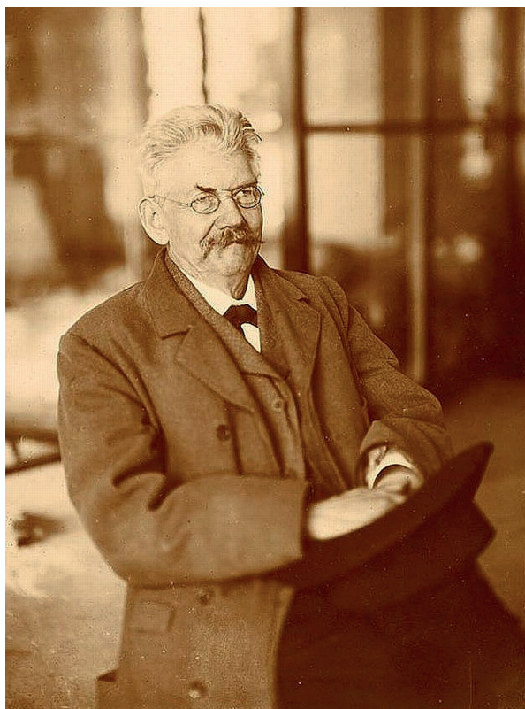
В. В. Радлов (1837–1918)

Вероятно, эти недостающие деньги были собраны и внесены. Кто их предоставил, мы не знаем. Предположим, это было сделано из пожертвований или главы буддистов Монголии Богдо-гэгэна VIII, или российских верующих-буддистов Бурятии и Калмыкии. О других жертвователях нам неизвестно.