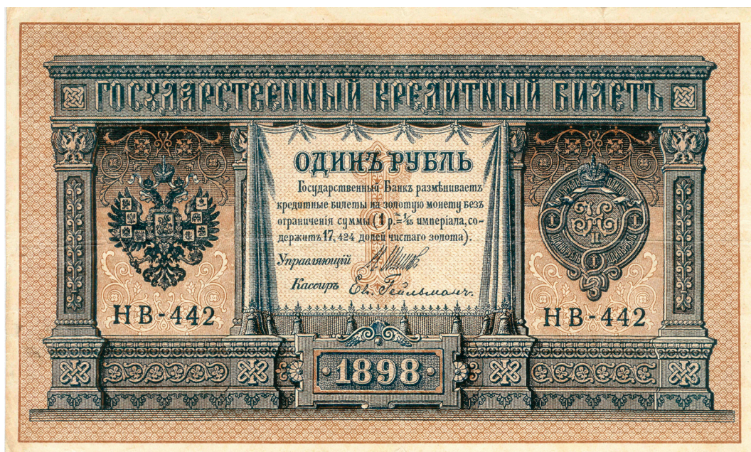
Один рубль образца 1887 г. с датой 1898 г. (выпуск 1898–1915 гг.)