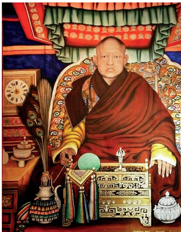
Богдо-гэгэн VIII (1869–1924). Худ. Балдугийн Шарав

Монголии в 1911–1921 гг., монарх Монголии с ограниченными правами в 1921–1924 гг.) — не указано сколько;