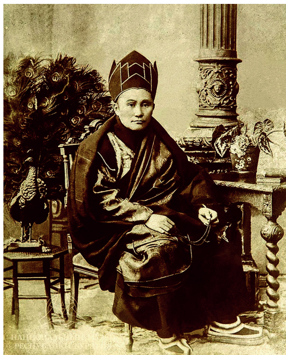
Агван Доржиев (1853–1938)

Однако к концу 1911 г. обнаружилось, что действительные расходы, как это нередко бывает, превысили указанную в смете сумму на 14 тыс. руб. (на 9,23%) [Жуков, 2021. С. 198 1 ].